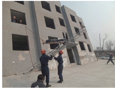
傾斜建物からの救助