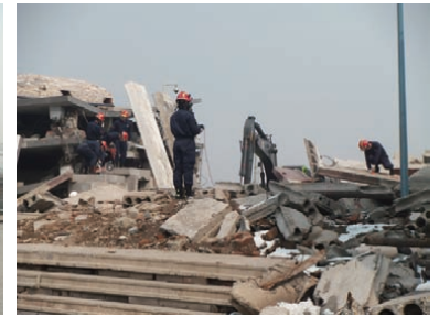
地中音響探知機を使用した検索救助